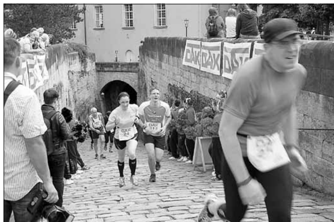
Die französische Rampe als letzter Anstieg vor dem Plateau verlangte den Läufer noch einmal alles ab.