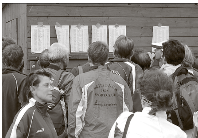
Großer Andrang am Ergebnisaushang. So konnte jeder Läufer kurz nach dem Zieleinlauf seine Platzierung und Zeit erfahren

jugendLand mobile Jugendarbeit Ein Projekt des Jugendring Sächsische Schweiz-Ost- erzgebirge e. V. Pflanzgartenweg 8b, 01814 Bad Schandau Tel.: (03 50 22) 5 04 42, Fax: (03 50 22) 9 26 40 E-Mail: info@jugendland.de Internet: www.jugendland.de