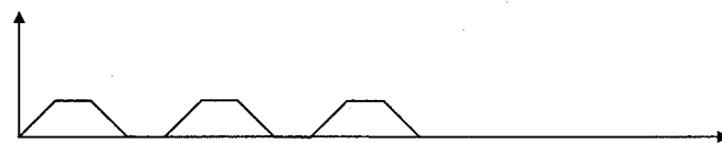
3 Töne von je 12 Sekunden Dauer mit 12 Sekunden Pause

Das Signal „Feuersalarm“ dient neben der Warnung der Bevölkerung insbesondere auch der Alarmierung der Einsatzkräfte.