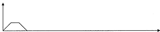
1 Ton von 12 Sekunden Dauer

Das Signal dient zur Überprüfung der Alarmierungseinrichtung sowie der Auslöse- und Übertragungseinrichtung. Der Probealarm wird jeden Mittwoch, 15:00 Uhr ausgelöst.