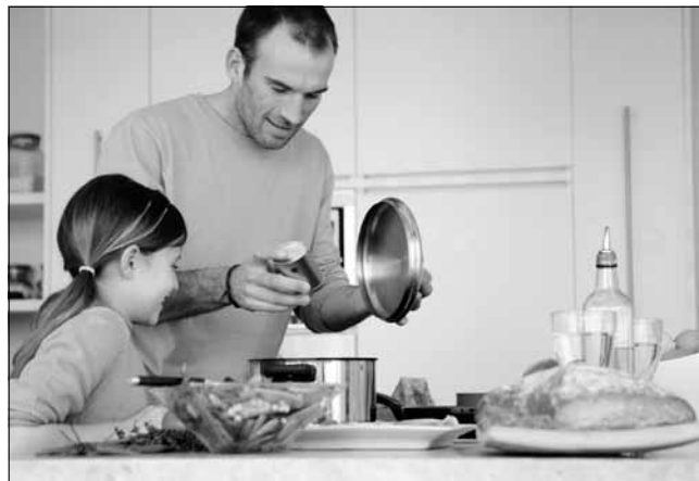
Salz macht viele Mahlzeiten erst zu einem genussvollen Erlebnis.

Die Informationsschrift kann kostenfrei beim Verband der Kali- und Salzindustrie e.V. angefordert werden (Reinhardtstraße 18A, 10117 Berlin, Telefon: 030-8471069-0, Fax: 030-8471069-21, E-Mail: info.berlin@vks-kalisalz.de), und steht zum Download auf www.vks-kalisalz.de bereit.