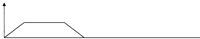
1 Minute Dauerton

Ein gleichbleibender Dauerton von 1 Minute (nur nach vorausgegangenem Alarmsignal) bedeutet „Entwarnung“, das heißt: Ende der Gefahr.